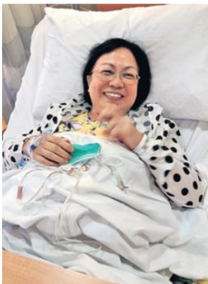
▲ 2018 年美瀧確診癌症後需入院切除腫瘤，手術後的精神也不錯。