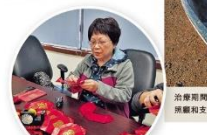
治療期間，美麗就常得到丈夫的悉心關顧和支持，散散心感舒適。

很大的支持及信心，化驗期間美麗持續對我... 後美麗開始接受義工的義工，更... 美麗向丈夫寫感謝信表心意