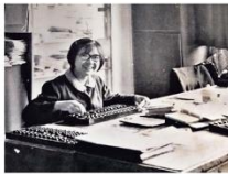
70年代，美麗由工廠轉職做會計員，每天朝上朝下打緊數，逐步學習會計知識。