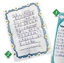
在雅麗氏何妙齡那打素慈善基金會的「前身心靈介入課程」中，美麗寫了一封給丈夫的感謝信（圖1），最終未能說出心口的感謝之情。而丈夫也寫了一封給家人的人信（圖2），慶幸可與太太同行。