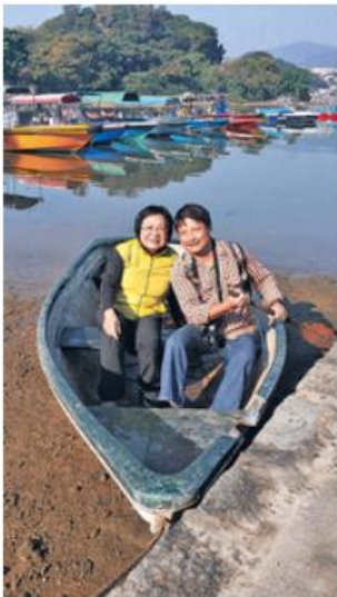
▲ 治療期間，美瀧說幸得到丈夫的悉心照顧和支持，故很衷心感謝他。