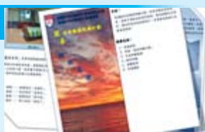
院友及家屬可透過「圓善安老服務」計劃單張了解詳情

在居家安老方面，慈善基金會一直關注長者的靈性需要及晚期照顧。舉例一位婆婆不願長住醫院，希望留在家中離世，需要晚期照顧，外展復康事工的護士會向病人及其家屬詳細解釋當中的利弊，讓他們商量決定，包括入住寧養院舍或安排私家醫生到診等。此外，雅麗氏何妙齡那打素護理院亦推出「圓善安老服務」，為晚期院友加強舒緩護理，安排「舒適飲食」及與其家人積極溝通，讓院友能在家人陪伴下於院舍安祥及有尊嚴地離世。