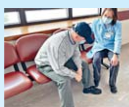
院牧收到緊急召喚，於病房外陪伴哀傷的家屬

李主席表示：「慈善基金會的服務宗旨是照顧、治療和安慰在身、心、靈上體弱、患病、年邁或需要協助的人。近年積極透過擴展院牧服務，努力開拓外展復康事工，加強醫護服務、長者院舍服務、持續進修學院培訓工作以至開展癌症病人支援服務等，以愛心服侍市民。」那打素醫院於1997年遷往大埔後，新院採用智慧型建築，推廣「治療環境的嶄新概念」。同時，亦開辦「臨床牧關教育」訓練課程，培訓專業院牧和義工，為醫院牧養工作提供專才。