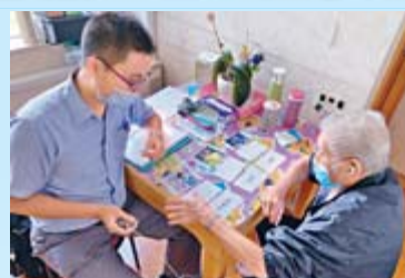
職業治療師指導長者進行認知訓練

梁醫生進一步解釋：「從『無牆醫院』理念延伸的那打素外展復康事工提供個人化的家居復康服務，包括復康訓練、家居改裝、教導照顧者復康知識等，尤其對長者有幫助，讓他們能把握最佳復