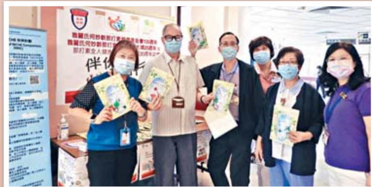
那打素全人健康持續進修學院成立20週年，特別推出「NICHE伙伴計劃」，傳承關顧文化，推廣全人健康