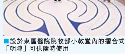
設於東區醫院院牧部小教堂內的摺合式「明陣」可供隨時使用

「無牆醫院」的理念由1970年代的「觀塘社區健康發展計劃」(即社康的前身)開始實踐。李主席續指出：「醫院為落實『無牆醫院』的遠景，醫院院牧扮演重要的角色，主動關顧病人及其家屬，照顧身心靈需要及提供協助，正如院牧會聯同外展復康事工一起上門探訪，安慰踏入生命晚期的長者及其照顧者，關顧他們的需要。院牧不但舒緩前線醫護人員的壓力，亦積極貫徹先賢創立的『全人醫護、無牆醫院』的信念。」