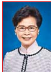
行政長官林鄭月娥