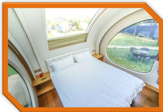
2) 【全新】世外公園露營車住宿