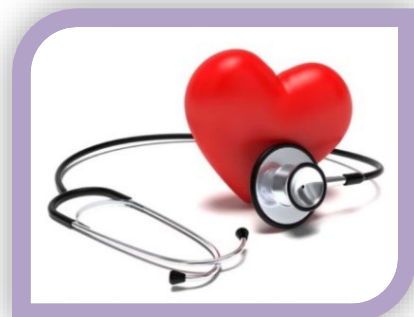
7) 身體健康檢查 及 8) 員工健康日