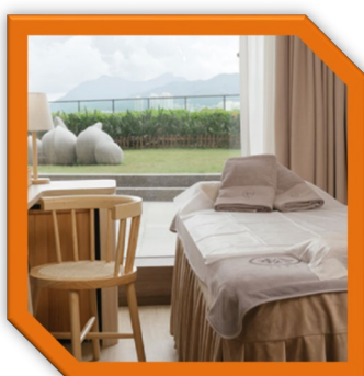
6) 【全新】松・Sung Massage 指定按摩套餐（全身）