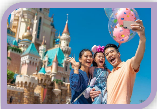
1) 香港迪士尼樂園特惠年票